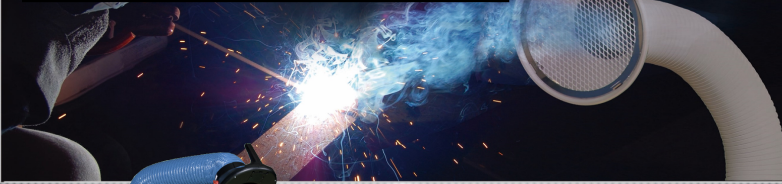
コトヒラ工業の溶接ヒュームコレクター 1.5kWタイプ(KSC-W03)